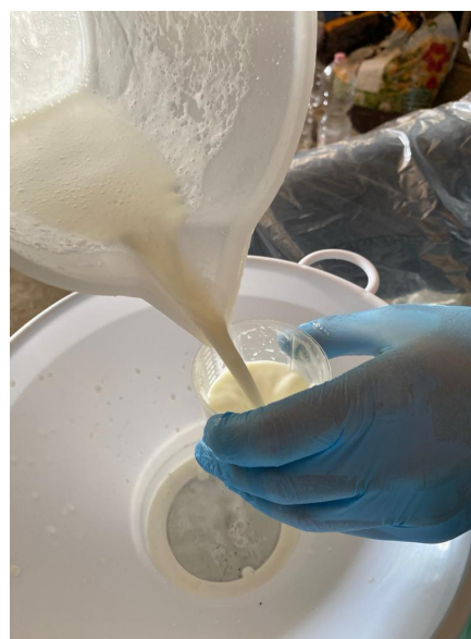
Foto 1 e 2: Misurazione delle quantità di latte prodotto per lattazione e prelievo di latte per le analisi qualitative ed elettroforetiche.